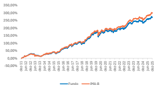
GRÁFICO DE DESEMPENHO

O fundo busca superar o IMA-B explorando de forma tática pequenas assimetrias em relação ao Índice e escolhendo os melhores vértices dentre os diversos vencimentos de NTN-Bs, para proteção do cotista frente a inflação de médio e longo prazos. Investimento em carteiras diversificadas de títulos e valores mobiliários de renda fixa, bem como em quaisquer outros ativos financeiros e modalidades operacionais disponíveis nos mercados financeiro e de capitais, buscando alocar, preferencialmente, em ativos financeiros indexados à índices de preços.