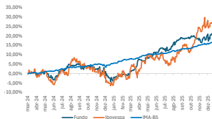
GRÁFICO DE DESEMPENHO

O fundo MAG Total Return tem como objetivo proporcionar ganhos de capital atrativos a médio e longo prazo utilizando majoritariamente o mercado de ações, superando o Benchmark no longo prazo, com a estratégia de ações long-biased que busca retornos consistentes e preservação de capital. O fundo combina essas estratégias de ações com uma exposição direcional flexível e busca utilizar outros mercados de forma tática para geração de valor.