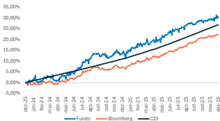
GRÁFICO DE DESEMPENHO - 24 MESES

O objetivo do fundo é maximizar o retorno investindo seus ativos no mercado de renda fixa global, variando de títulos do governo com rating AAA, até títulos high yield e de mercados emergentes, com proteção cambial. A gestão do Agon Strategic Global Bond Fund busca oferecer uma carteira direcionada aos investimentos apenas em Renda Fixa com amplas oportunidades, visando explorar e diversificar os segmentos do mercado, com uma exposição dinâmica, ativa e de alta convicção à renda fixa.