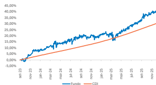
GRÁFICO DE DESEMPENHO

É um fundo multimercado que combina títulos privados e públicos com uma parcela de ações. A gestão do Aegon Global Diversified Income Fund busca proporcionar um bom retorno com um nível de risco equilibrado, dando preferência ao crescimento de capital, sem subestimar a renda por dividendos.