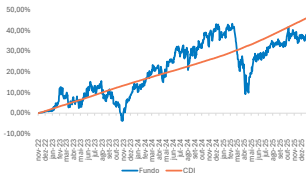
GRÁFICO DE DESEMPENHO

O objetivo do fundo é maximizar o retorno, investindo indiretamente no fundo Aegon Global Sustainable Equity Fund que detém uma carteira diversificada de ações globais que atendam aos critérios de sustentabilidade. A gestão do fundo no exterior busca oferecer um portfólio de alta convicção que utiliza a análise de sustentabilidade como parte central do processo de pesquisa fundamental, identificando empresas inovadoras e disruptivas que estão fornecendo soluções para os desafios de sustentabilidade no cenário atual.