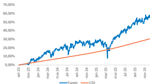
GRÁFICO DE DESEMPENHO

O fundo investido no exterior, Aegon Global Equity Income Fund, investe num pool de ações entre 40-50 das empresas de alta qualidade, a nível global, visando aquelas com dividendos mais atraentes, assim como , as que possam contribuir com o crescimento constante do capital investido. A gestão ativa visa manter baixos os níveis de turn over do portfólio e limitar os drawdowns nas quedas do mercado.