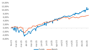
GRÁFICO DE DESEMPENHO

O fundo MAG Global Credit BRL FIF Multimercado aplica no fundo offshore AEGON HIGH YIELD GLOBAL BOND FUND, que possui estratégia de selecionar ativos de crédito que entreguem altas taxas de retorno na renda fixa, baixa correção com os principais ativos de renda fixa global e aliado a uma volatilidade menor que o mercado de ações no longo prazo.